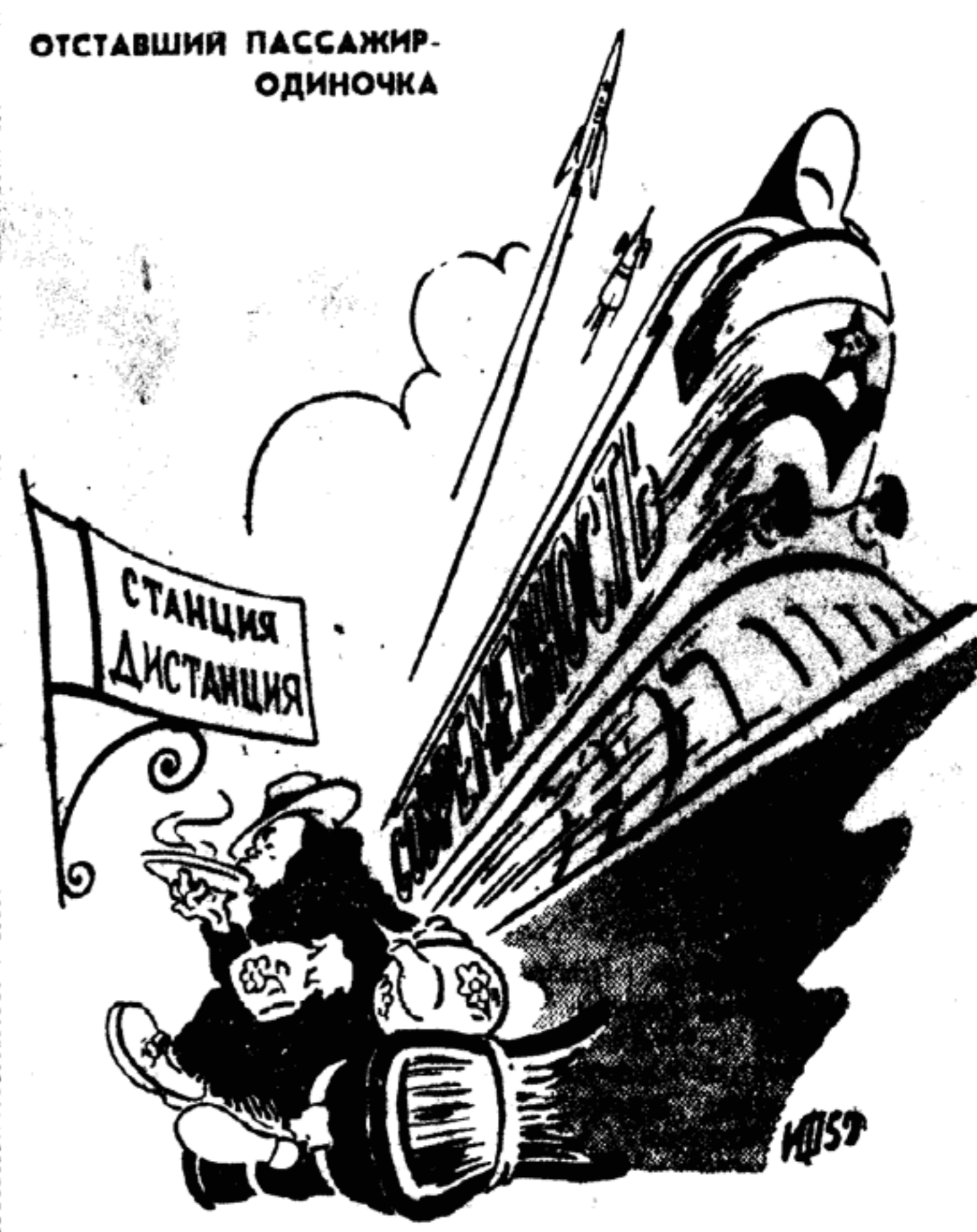
Рис. И. ФРИДМАНА