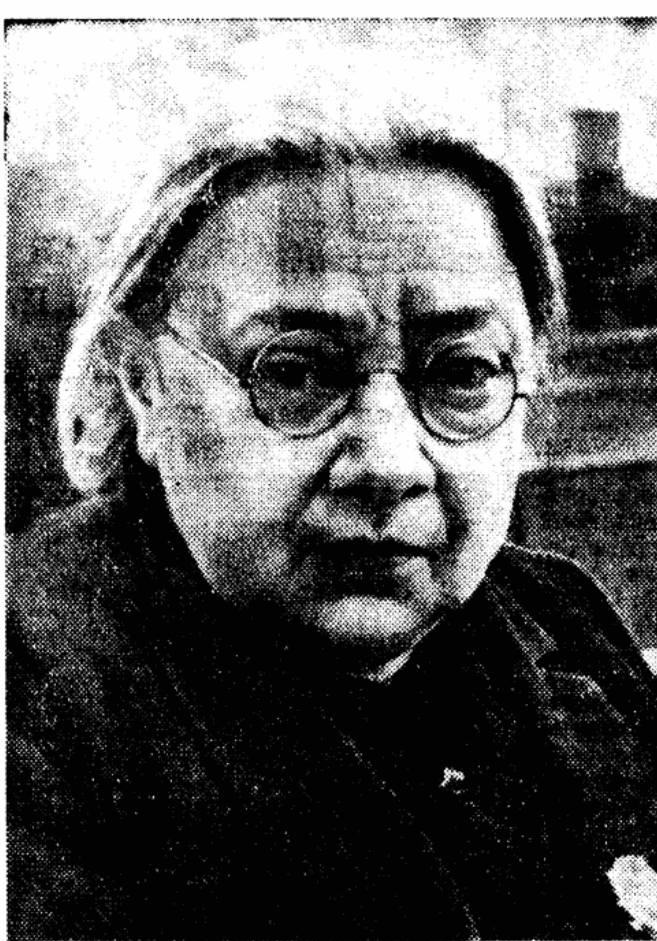
Н. К. Крупская