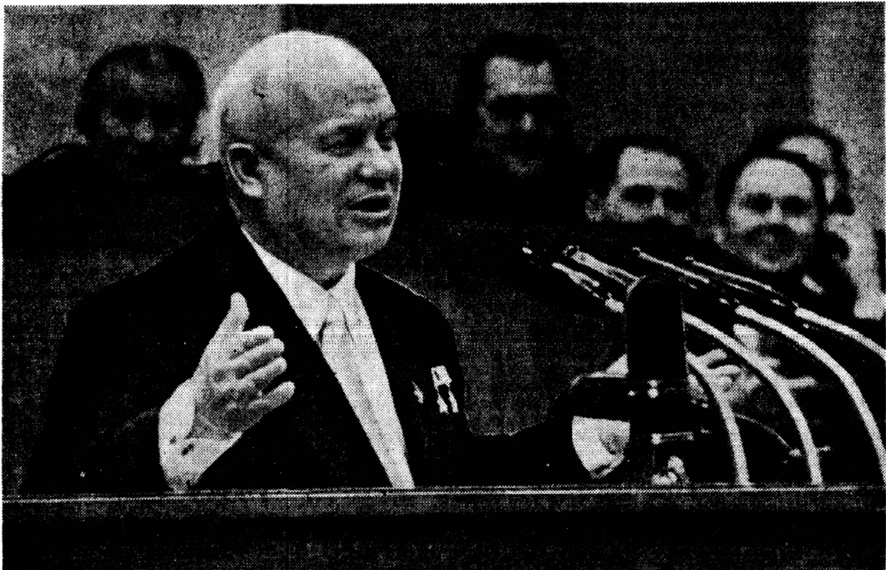
Встреча Первого секретаря ЦК КПСС, Председателя Совета Министров СССР товарища Н. С. Хрущева с избирателями Калининского избирательного округа города Москвы. С речью выступает кандидат в депутаты Верховного Совета РСФСР по Калининскому избирательному округу Н. С. Хрущев.