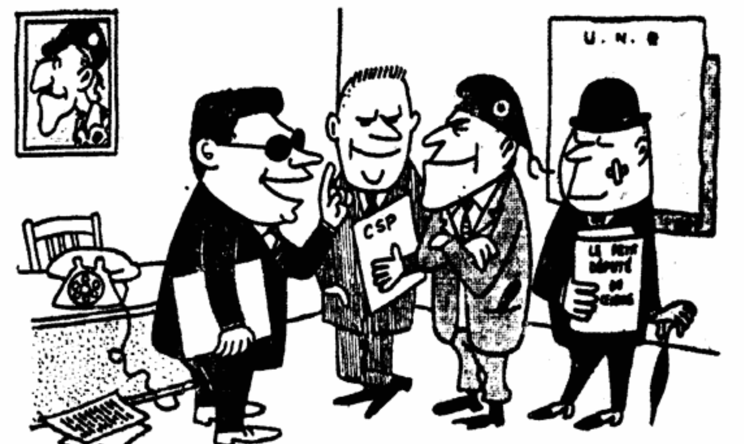
Жак Сустель — Надеюсь, вы запомните: мы, члены партии ЮНР, вовсе не фашисты и не имеем никакого отношения к Юндам-бандам...

Рисунок художника Намба из французской газеты «Юманите»